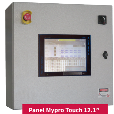
Panel Mypro Touch 12.1"